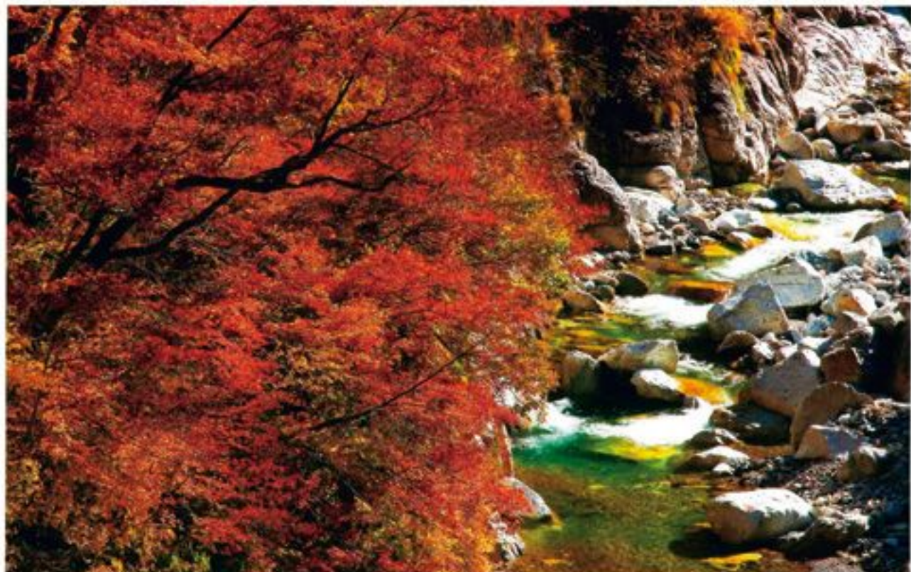
絶谷峽谷の紅葉(自由スーパー林道にて・岐阜県～石川県)