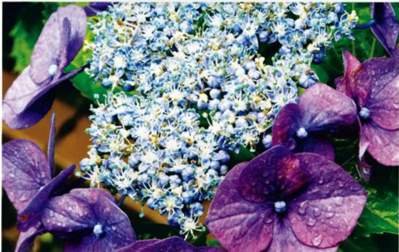
観光-アジサイロードの雲陽花(岐阜県関市)