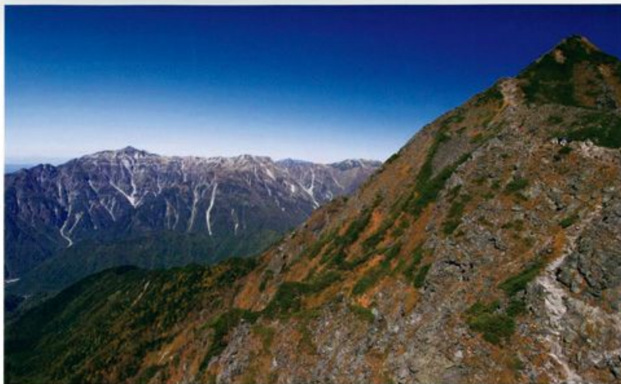
西穂高岳から福心堂へ向(岐阜県高山市)