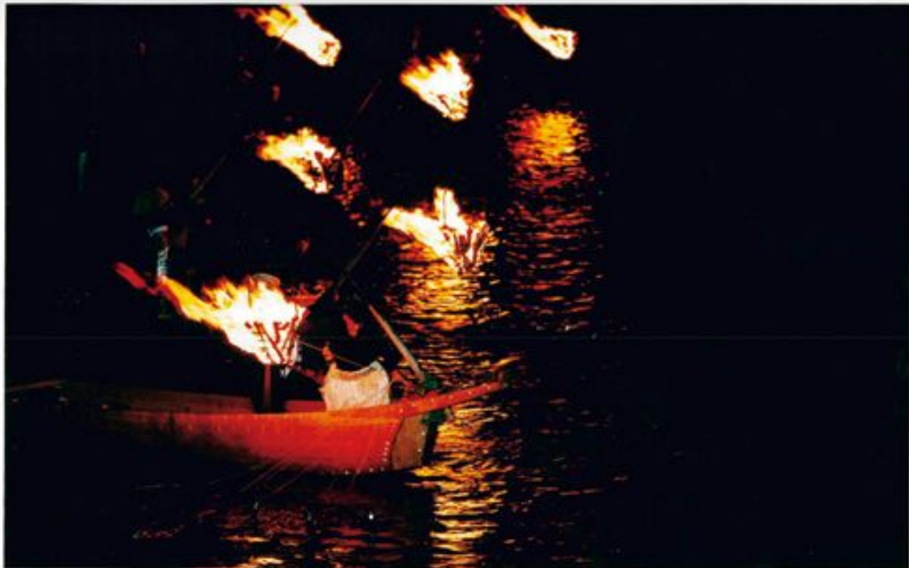
長良川舟祭り「燈がらみ」(岐阜県岐阜市)