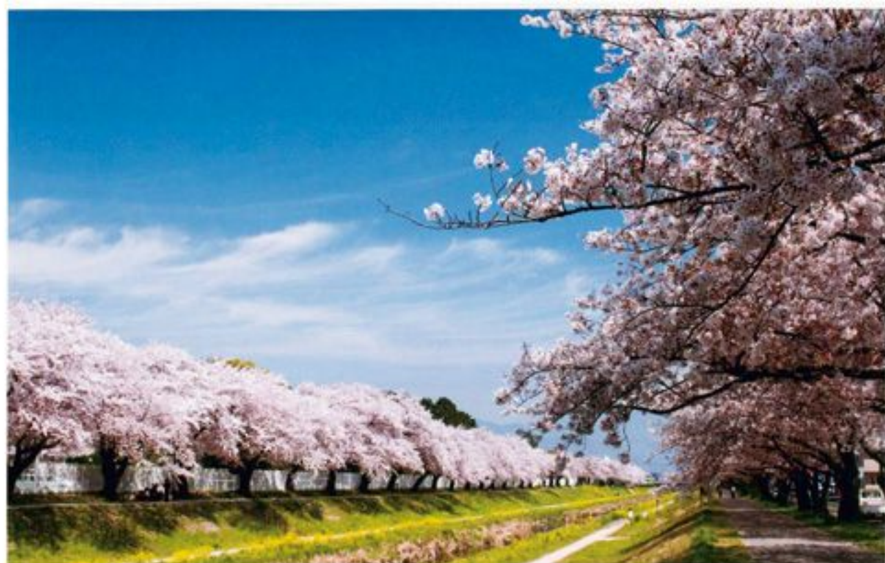
長良川の桜並木(愛知額巻川市)