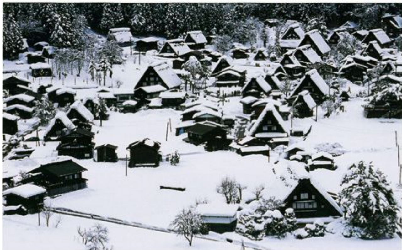
冬の白川郷合掌集落 (岐阜県白川村)